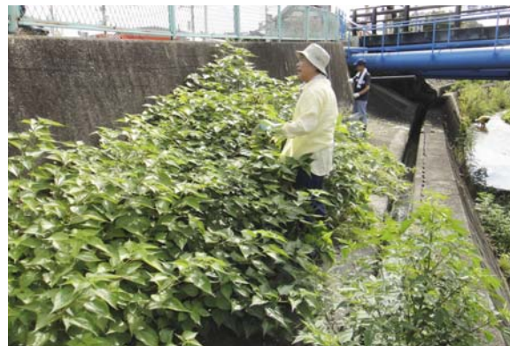
宮内橋北側ピフォー