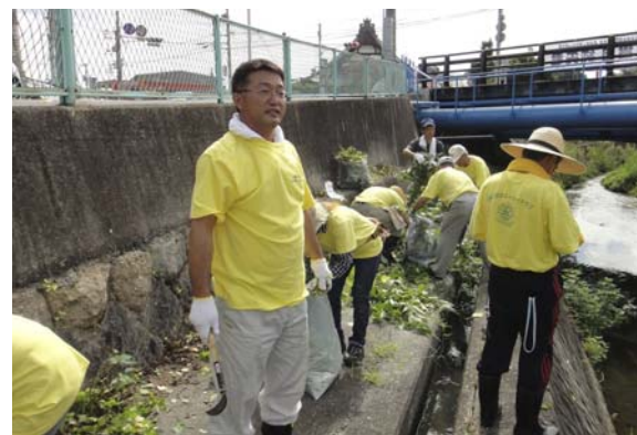
宮内橋北側アフター