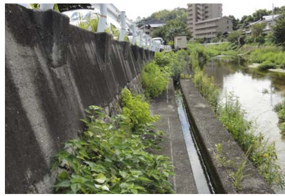
宮内橋南側ピフォー