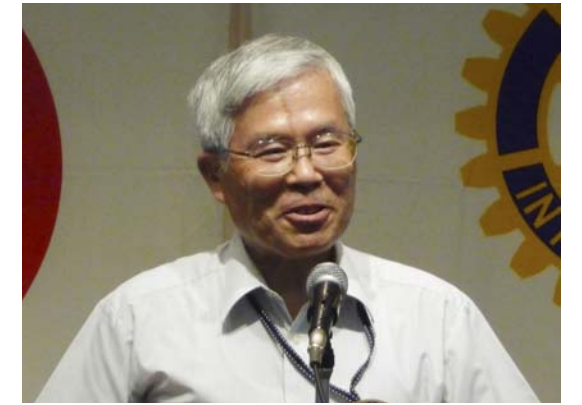
水保全活動 御手洗川清掃の報告