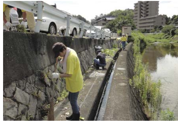
宮内橋南側アフター