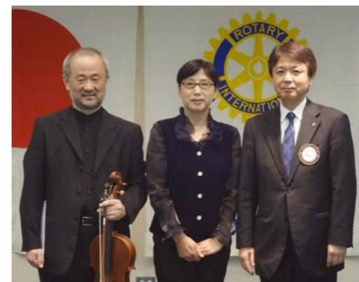
梶田会長よりお礼のお言葉