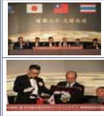
「姉妹クラブ」調印式

■台北市南港ロータリークラブ創立20周年記念式典出席 (2017.3.17 於: 台北明利ホテル)