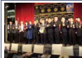
2014-15RI会長ゲイリーC.K.ホアン氏を囲んで

■台湾第3520地区第17分区合同例会出席 (2017.3.16 於: リゾート・タイペイホテル)