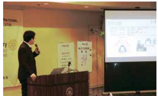
第1156回 広島サンブラザ 2024年2月19日