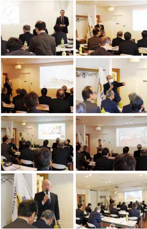
第1155回 広島サンブラザ 2024年2月5日